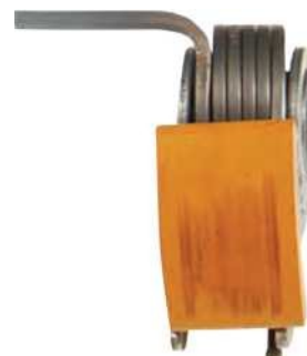
Az 1.500 mérföld bejáratási idő utáni Royal Purple olajjal használt láncfeszítő.