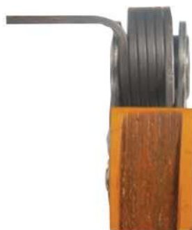
A gyártó szintetikus olajjal használt láncfeszítő.