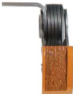
A hagyományos olajjal használt láncfeszítő.

Hasonlítsa össze a képeket, a kopás különbség drasztikus: